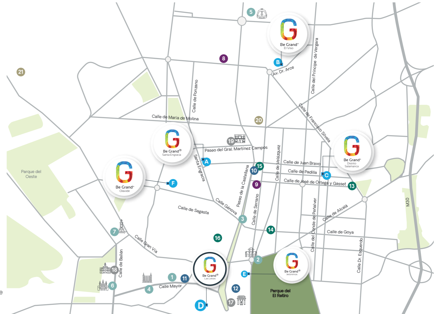
D Be Grand Las Letras Calle Fúcar N°. 15, Centro, 28014 Madrid