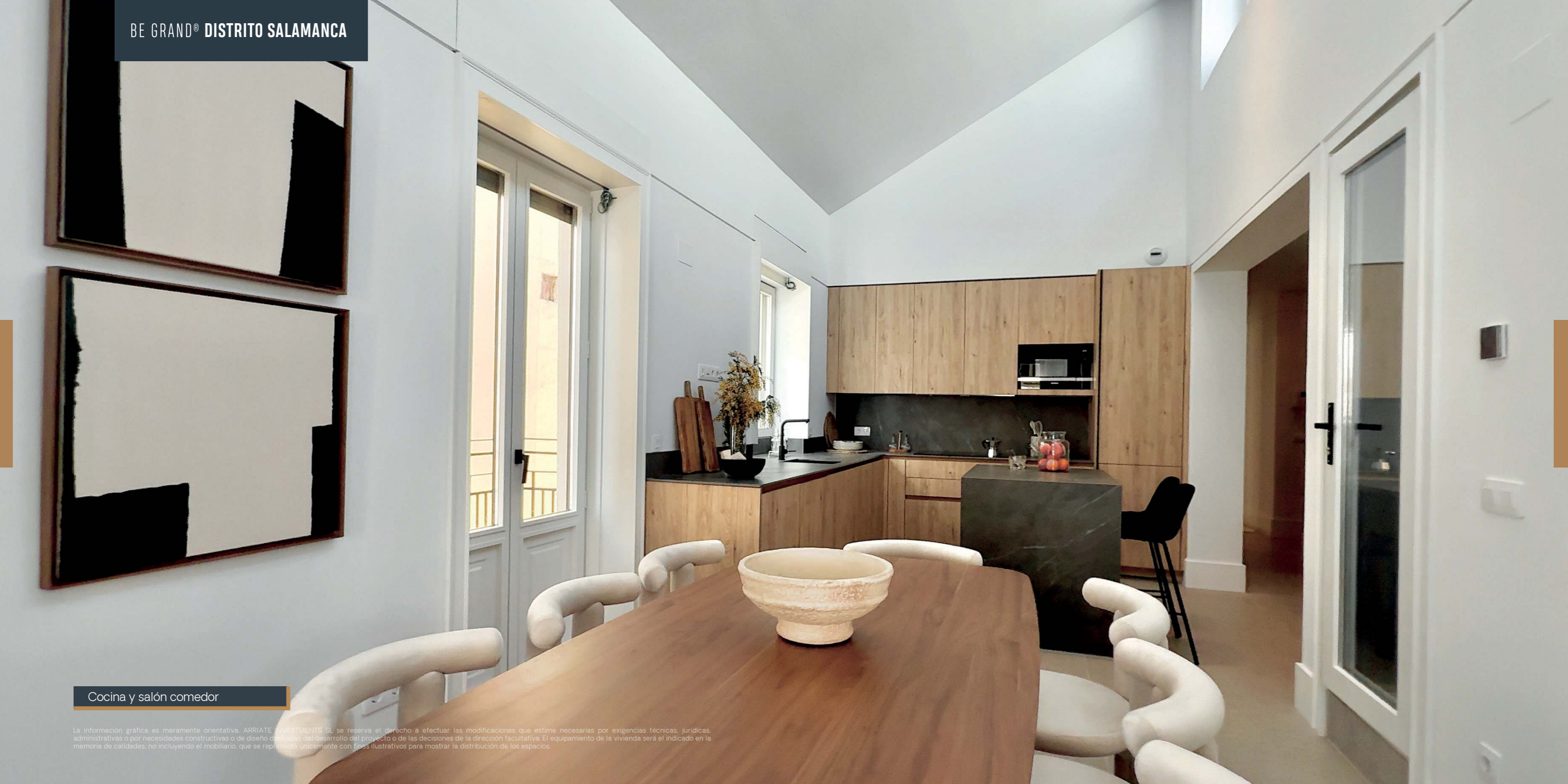
Cocina y salón comedor