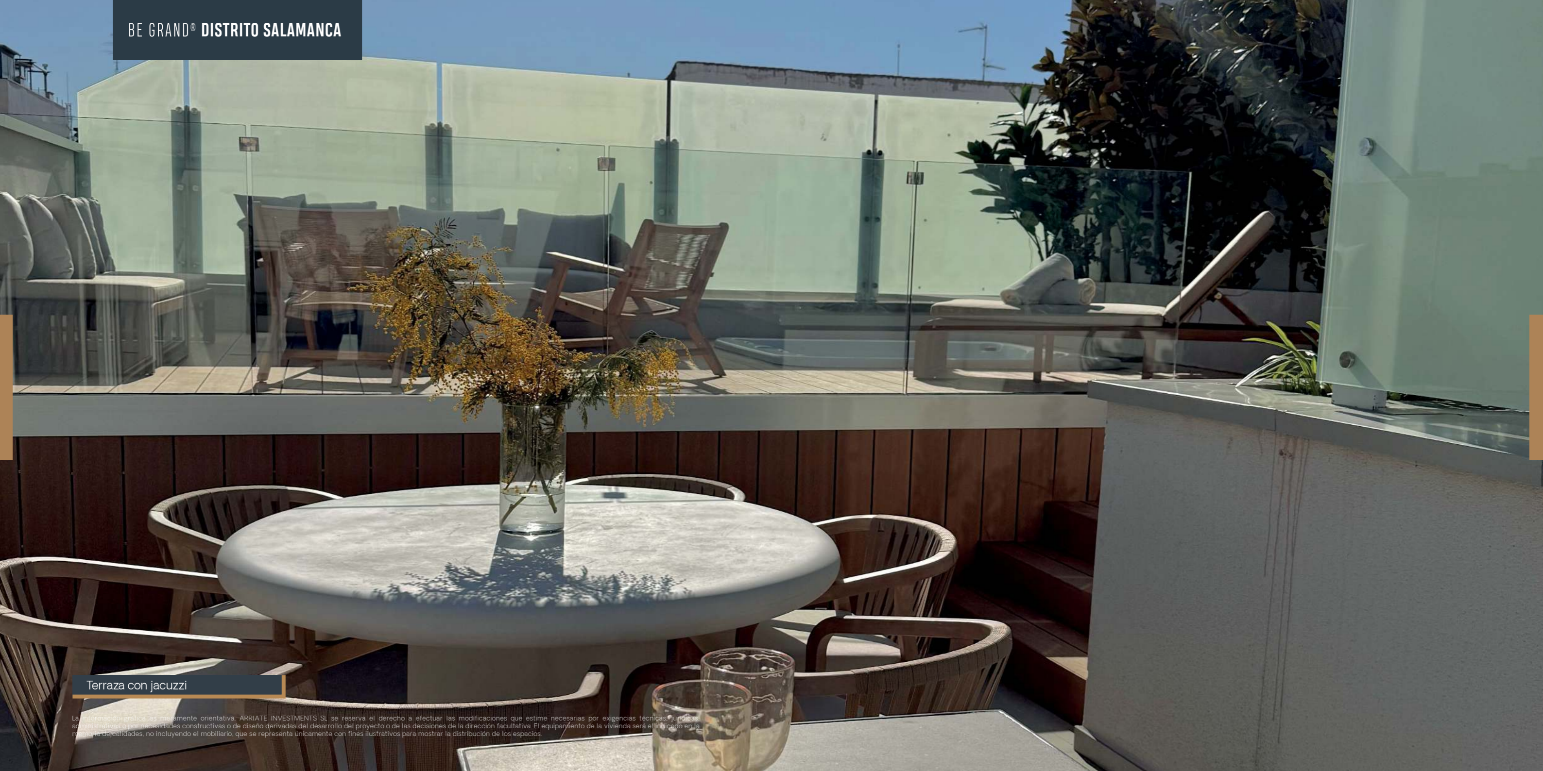
Terraza con jacuzzi