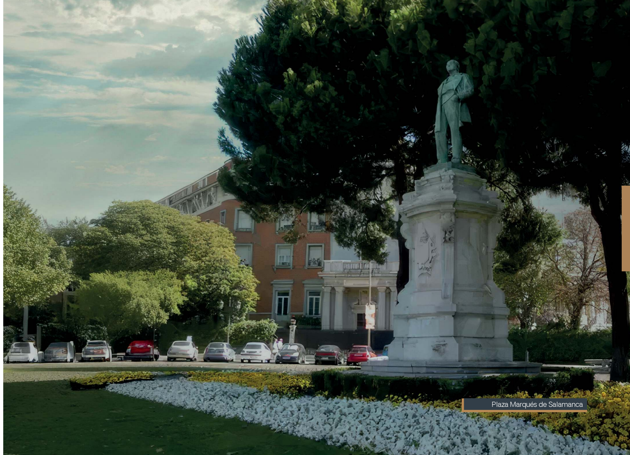
Plaza Marqués de Salamanca

Su construcción data de la segunda mitad del siglo XIX y corresponde a la ampliación urbanística llevada a cabo durante el reinado de Isabel II. El precursor al que se debe su nombre fue el malagueño José de Salamanca y Mayol, Marqués de Salamanca, quien concibió un nuevo emplazamiento con una cuidada edificación que albergara a las clases aristocráticas y burguesas de Madrid. De estilo decimonónico, se caracteriza por su especial distribución regular en forma de damero con calles perpendiculares. Sus edificios gozan de especial interés gracias a su calidad arquitectónica y la belleza de sus fachadas.