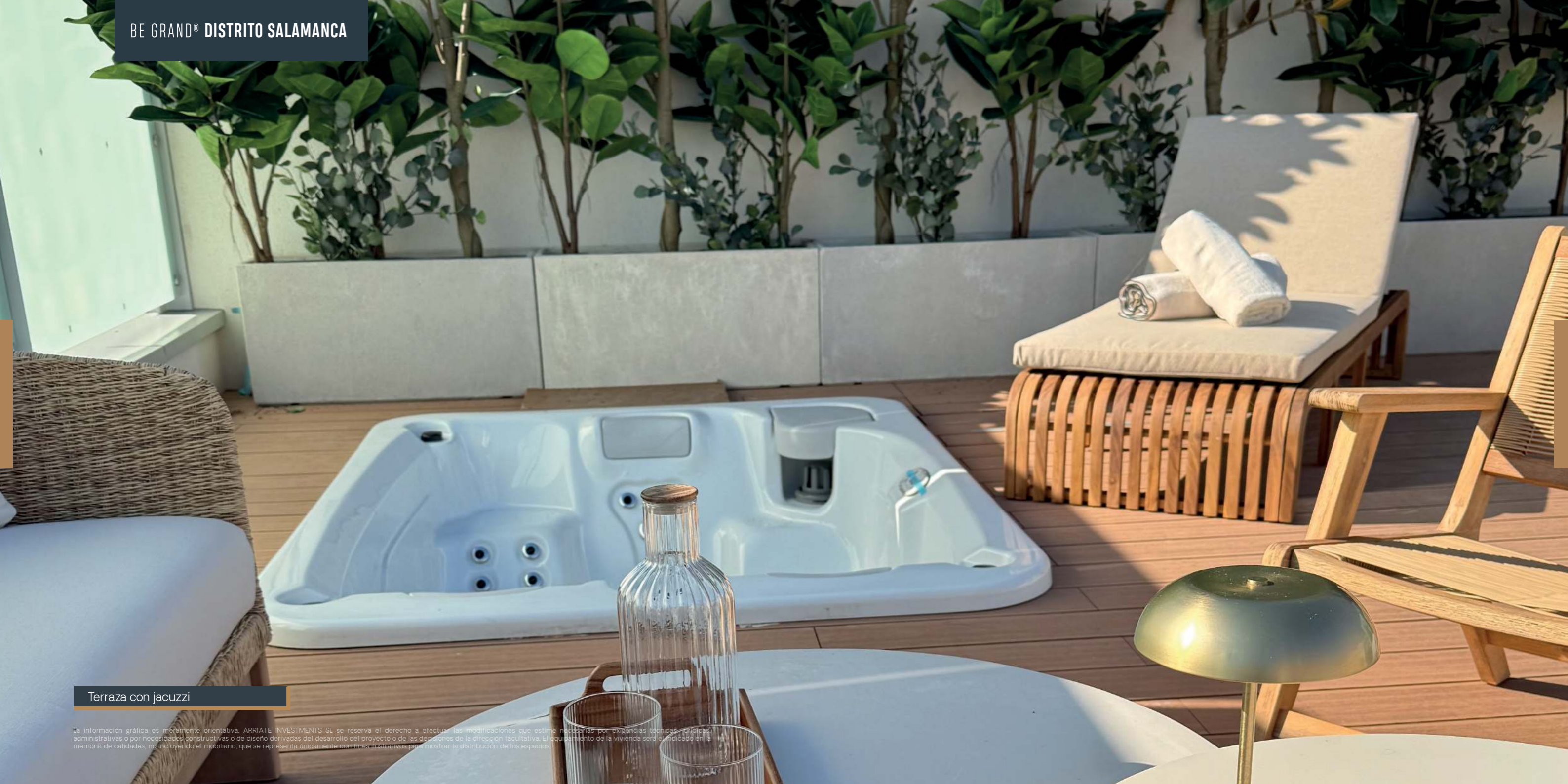
Terraza con jacuzzi